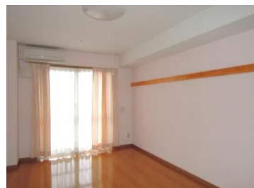
居室（家電・家具は持ち込みです）