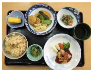
バラエティーに富んだ季節の料理を調理のプロが毎日提供致します