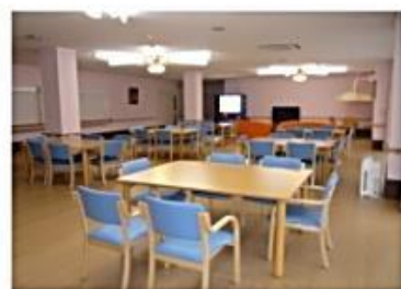
2階・4階 食堂ホール