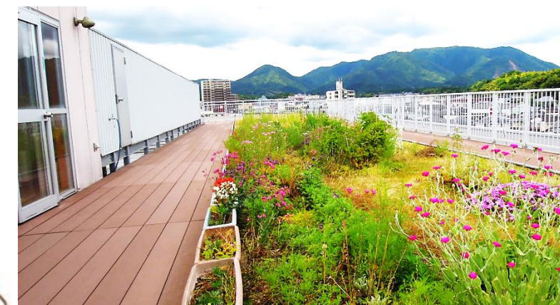
入居者様用花壇と散歩回廊(屋上)