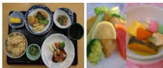
バラエティーに富んだ季節の料理を調理のプロが毎日提供致します